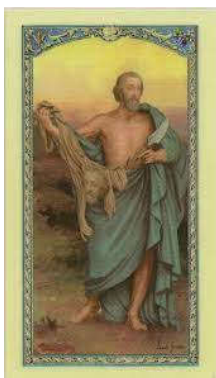
sv. Jernej, ap.